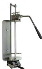
Appareil dosage manuel « Profi », central

sans trancheur 25413 0000 avec trancheur 25414 0000