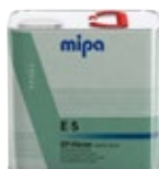
Mipa EP-Härter E 5 extra kurz epoxy edző extra gyors

6 x 0,5 l | 23680 0000 4 x 2,5 l | 23682 0000