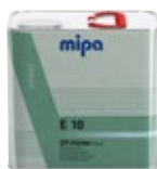
Mipa EP-Härter E 10 kurz epoxi edző gyors

Mipa EP-Härter E 10 kurz Epoxy hardener fast